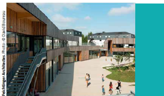
Pôle d'excellence éducative Albert Camus, Coulaines

Grand succès dans le département de la Sarthe, cet événement mise sur la proximité des sites sélectionnés car elle inscrit durablement la sensibilisation à l'architecture dans la perception de notre environnement bâti.