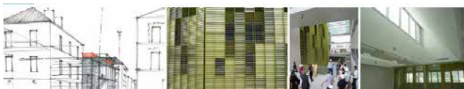
Photographies CAUE de la Vendée et Illustration Daniel RUBIN

Comment le bâtiment s'inscrit-il dans la ville ? Comment dialogue-t-il avec son environnement ? Comment s'organisent les différentes fonctions du bâtiment ? Quels sont les espaces communs, comment s'articulent-ils ? Quelles sont les caractéristiques des différentes pièces ? Comment répondent-elles aux besoins des usagers ? Quelles sont les contraintes d'un tel lieu ?