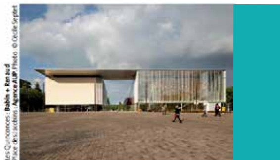
Plateau des Jacobins, Le Mans